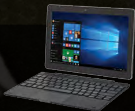
I miejsce Tablet Lenovo MIIX 310-101CR + stacja dokująca

Zapisz ją w formie fraszki i wyślij do nas! Cenne nagrody czekają!