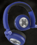
III miejsce Słuchawki bezprzewodowe JBL Synchros E40

Szczegóły konkursu na stronie www.czasbohaterow.pl